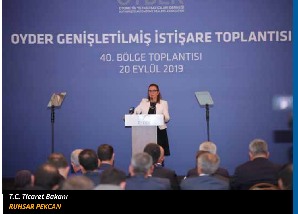
T.C. Ticaret Bakanı RUHSAR PEKCAN

İhracat Master Planı'nda belirlenen hedef sektörler arasında otomotiv sektörünün de yer almasına değinen Pekcan, "İş dünyasının taleplerini diğer bakanlıklarla da takip ediyoruz. Bu hedefleri belirlerken de teknoloji ve katma değeri yoğun ihracatımızı nasıl artırırız bunların üzerinde durmaya çalıştık. Otomotiv de bunların en başında gelen, katma değeri yüksek teknoloji oranı yüksek ihracat kalemlerimizden.